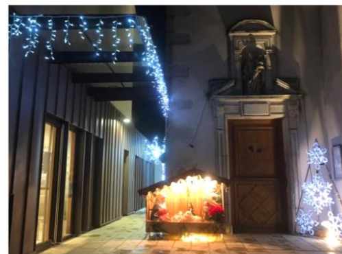
L'entrée de la mairie

Un site Internet « Laneuvelotte.fr » vous est désormais accessible. Un service d'alerte sms est créé pour vous alerter en cas d'évènements imprévus. Le numérique est dans nos vies, le papier est dans nos mains, les deux supports seront utiles pour accroître ce lien avec vous. Dans l'attente de se retrouver les uns et les autres comme j'aurais aimé vous le proposer à l'occasion de la cérémonie des vœux, annulée par la force des choses. Conservons cette force, gardons espoir, esprit d'entreprendre et énergie et ...Welcome 2021 !