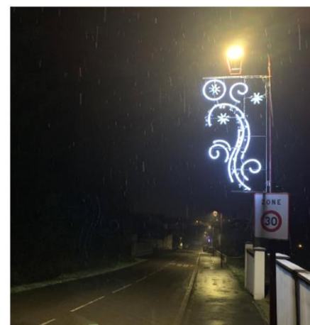
L'entrée du village