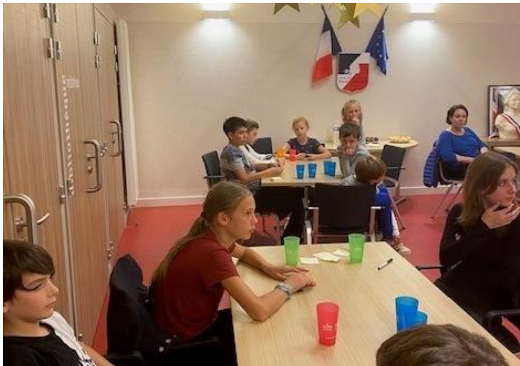
LES JEUNES EN PLEINE REFLEXION ET ACTION POUR LEUR VILLAGE