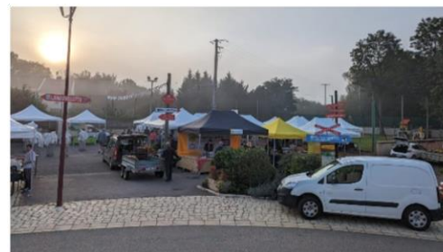
Une vingtaine de producteurs, de bons produits et des habitants ravis et gourmands au marché de producteurs locaux organisé le 30 septembre 2023 par le comité des fêtes

Permanences de mairie : lundi 15h-19h (présence des élus à partir de 17h) et vendredi 15h-18h