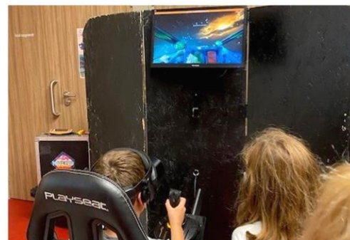
Réalité virtuelle lors de la soirée gaming des jeunes du village : un succès, vous pensez bien !