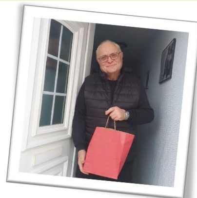
Le colis des aînés

Enfin, il a été précisé que la fourrière animale reste finalement de la compétence de l'intercommunalité.