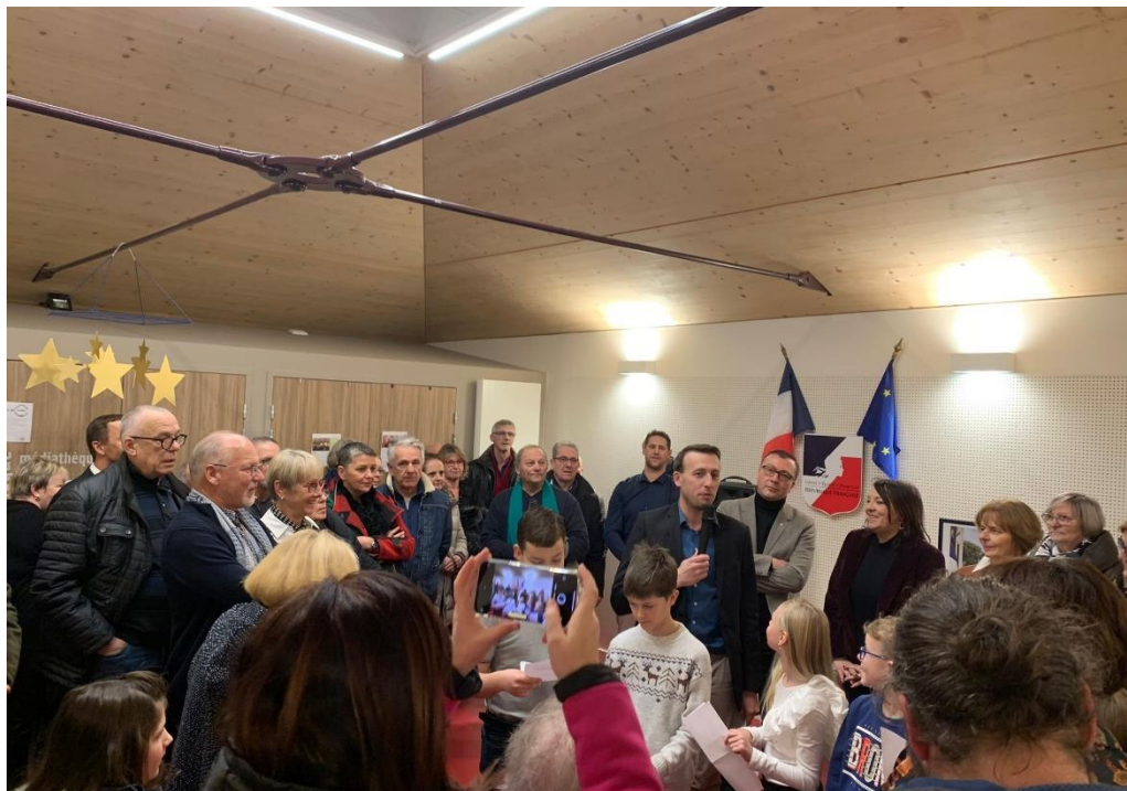
LA CEREMONIE DES VŒUX 2024 DE L'ÉQUIPE MUNICIPALE